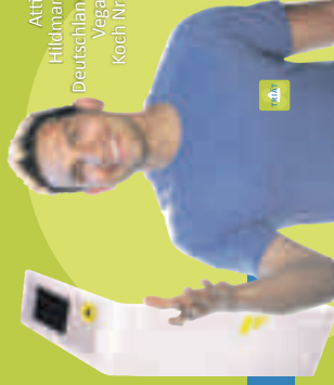
Atila Hildmann Deutschlands Vegan- Koch Nr. 1